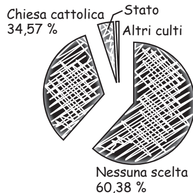
Scelte dei contribuenti

- La mancata espressione della destinazione risulta molto diffusa perchè i contribuenti esonerati dalla presentazione della dichiarazione non consegnano il modello CUD col quale potrebbero effettuare la scelta